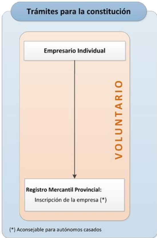
Empresari@ individual AUTÓNOM@